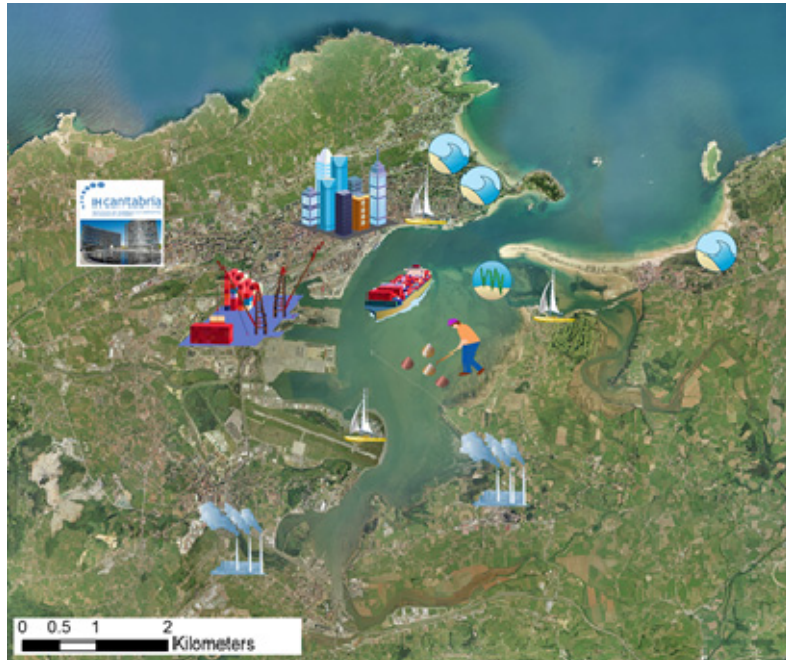
Figura 2. Representación gráfica de la multitud de usos y servicios que se dan en la Bahía de Santander (Símbolos: cortesía de la Integration and Application Network, University of Maryland Center for Environmental Science: ian.umces.edu/symbols/ ).

Desde junio de 2016, la Bahía de Santander forma parte de la red World Harbour Project. La multitud de servicios ambientales, sociales y económicos de la Bahía de Santander (Figura 2), junto con la amplia experiencia de IH Cantabria en el ámbito de los sistemas portuarios y el actual interés por la innovación de la Autoridad Portuaria y del Gobierno de Cantabria, han sido determinantes para la inclusión de la Bahía de Santander en la red.