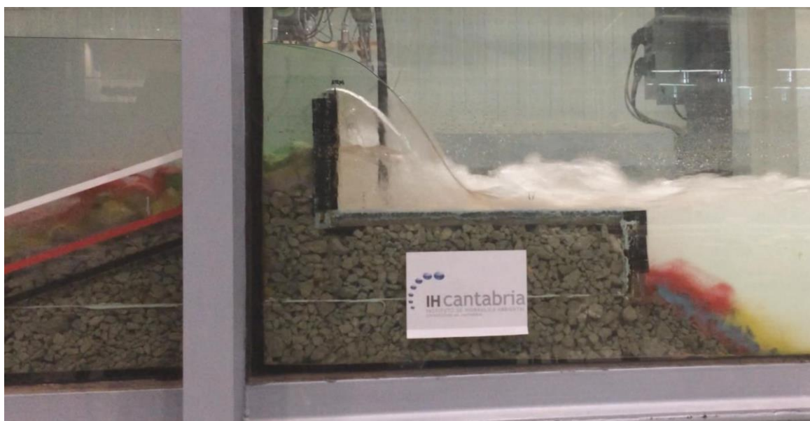
Fig. 2 Visión lateral del dique ensayado durante un experimento de corriente en el que el rebase cae directamente sobre la cara horizontal del espaldón.

Como resultado de este análisis, se ha desarrollado una metodología de diseño de espaldones bajo este tipo de condiciones, basándonos para ello en la metodología presentada por Martin et al. (1999), pero extendiéndola para las presiones que un tsunami es capaz de generar. Esta nueva metodología, que será presentada en estas jornadas, incorpora por primera vez las acciones de tsunamis al diseño de espaldones de diques en talud.