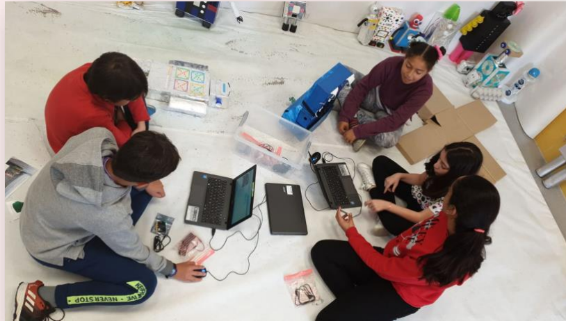
Figura 2. Aulas sensibles a las cuestiones de género, buscando la igualdad y la equidad.