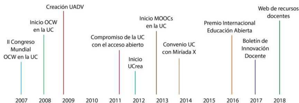
Figura 1. Evolución de los proyectos relacionados con Educación Abierta en la UC. Elaboración propia.

La experiencia nos indica que los resultados de estas iniciativas se consiguen a medio-largo plazo. Como toda apuesta, requiere no sólo de buena voluntad sino también de recursos humanos y medios técnicos. Conviene disponer asimismo de un órgano ejecutivo que analice resultados y dificultades, y que dicte directrices para potenciar este tipo de enseñanza.